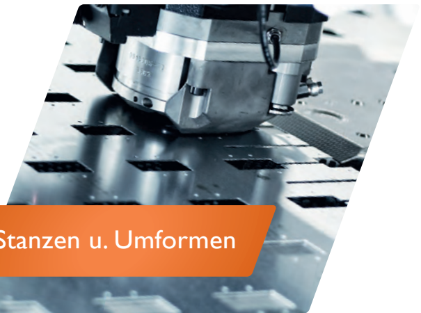
Stanzen u. Umformen